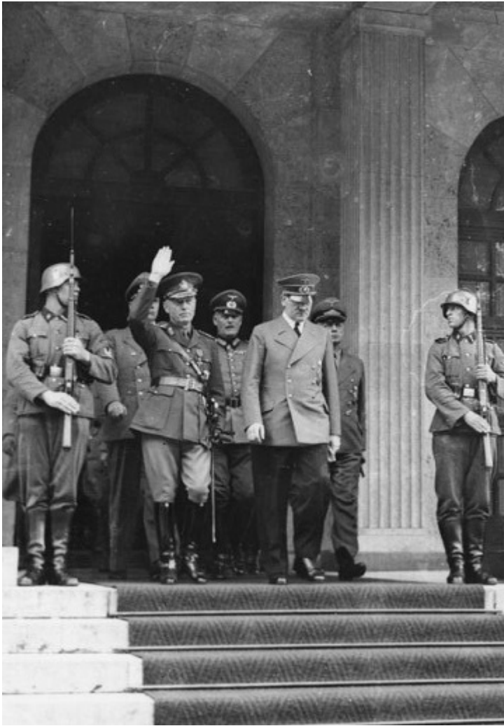
Встреча Гитлера с Йоном Антонеску