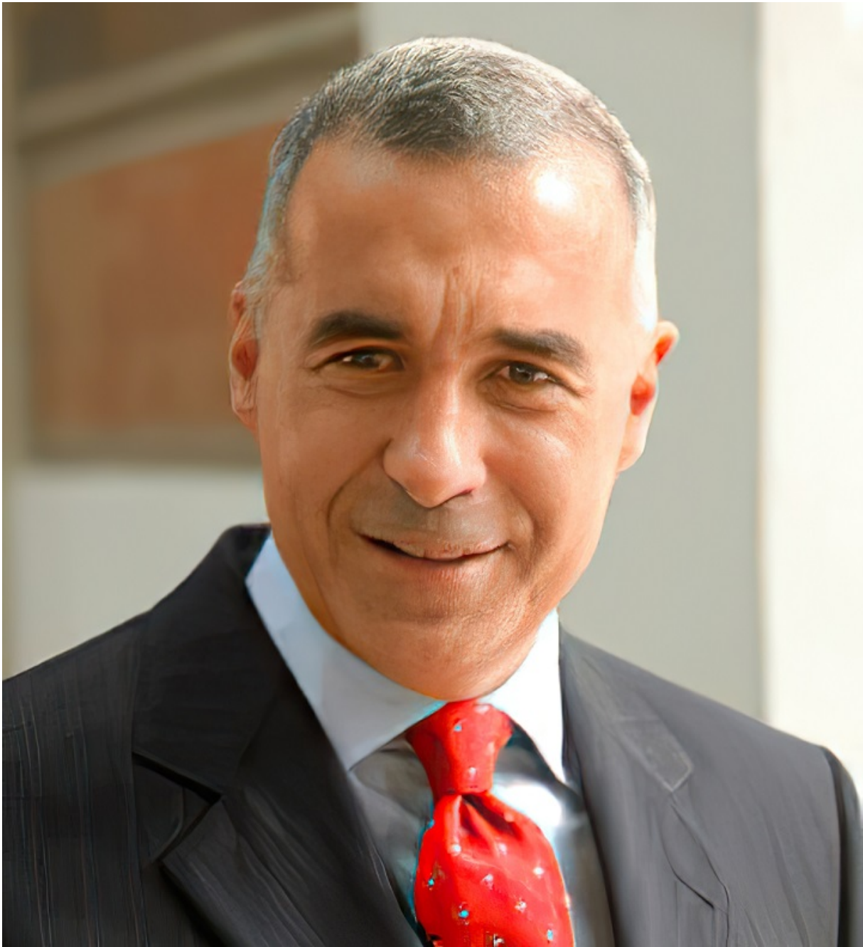
Калин Джорджеску.

Калин Джорджеску из крайне правой партии AUR — известный человек в Румынии. 17 лет он проработал в ООН в качестве эксперта в области устойчивого развития, занимал пост главы Института глобального развития ООН, возглавлял Европейский исследовательский центр Римского клуба.