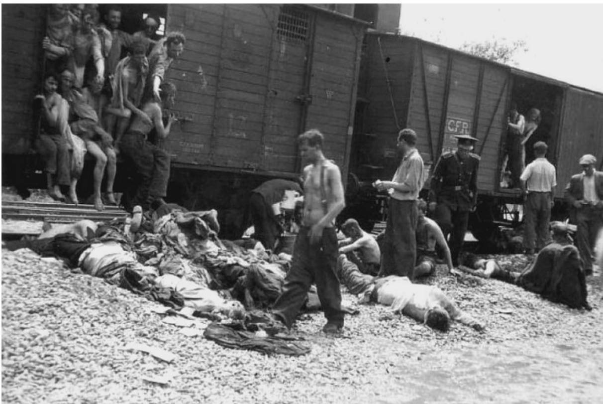
Жертвы еврейского погрома в Яссах, 1941

Так или иначе Джорджеску стал первым за много лет видным политическим деятелем, открыто вступившимся за Кодряну в эфире крупного телеканала, — сообщает JTA. На этом фоне характеристика Антонеску как «мученика», данная бывшим экспертом ООН, не привлекла столь пристального внимания.