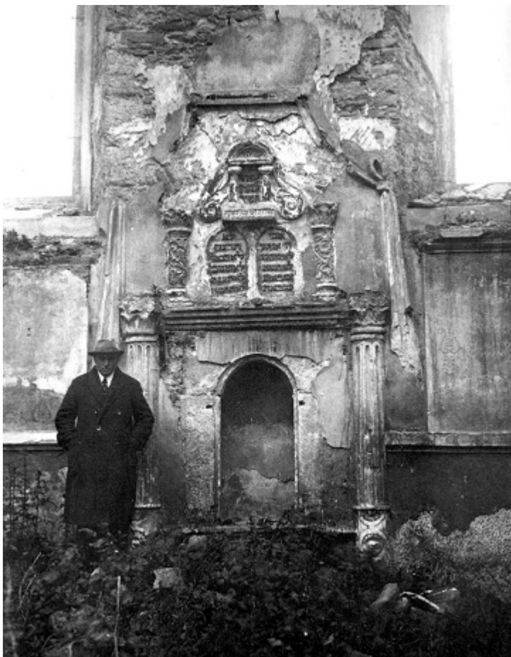
Арон-кодеш синагоги, 1920-е