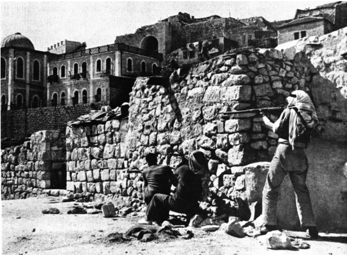
Солдати Арабського легіону обстрілюють єврейський квартал Єрусалима, 1948