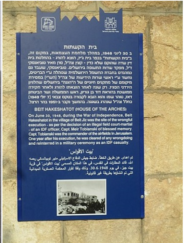
Пам'ятна дошка на будівлі, біля якої був розстріляний Тувіанський