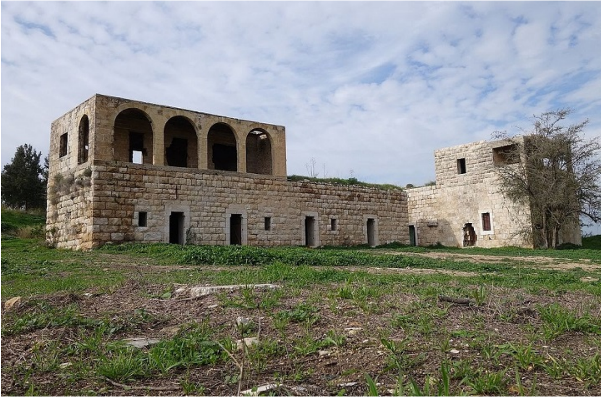
Тут був розстріляний Меїр Тувіанський

Тіло закопали відразу. Сім'ю не повідомили, але коли дружина Меїра зчинила галас, прем'єр-міністр Давид Бен-Гуріон призначив комісію на чолі з головним військовим прокурором, який і докопався до істини. З Тувіанського зняли всі обвинувачення, поховали з усіма почестями на військовому цвинтарі на горі Герцля в Єрусалимі та навіть ретроактивно підвищили у званні до майора, призначивши сім'ї відповідну пенсію. За рік після суду, 1 липня 1949 року, Бен-Гуріон написав удові офіцера, що її чоловік «невинний, а вирок і страта — трагічна помилка».