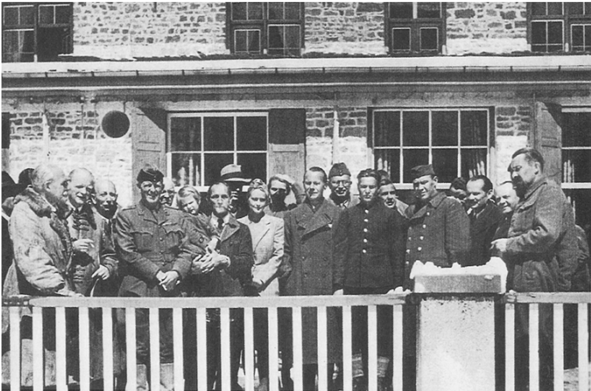
Пастор Німеллер (з трубкою в роті і дитиною на руках) після звільнення из Дахау, 5 травня 1945

Під час ув'язнення теологічний підхід Німеллера зазнав змін. Він визнав розп'яття Ісуса Христа подією для всіх народів, стверджуючи, що церква, насамперед, має працювати над подоланням кордонів, рас та ідеологій. Він також усвідомив роль, яку відіграла церква в узурпації влади націонал-соціалістами.